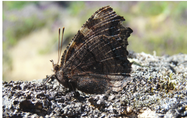
Onderzijde grote vos (02-05-2015, Cáceres, Spanje).

Zoals andere schoenlappers, overwintert de grote vos als volwassen vlinder in beschutte, koele en donkere plaatsen zoals in holle bomen, houtstapels of bunkers. Het is niet ongevoen om ze dan samen met andere schoenlappers aan te treffen. Na de winter, vooral in april en mei, zoekt het wijfje voor de eiafzetting vaak vrijstaande, zonbeschenen bomen uit waar ze haar gele eitjes rond de hoge twijgen in ringvorm legt. Uiteindelijk verkleuren de eitjes naar donkerrood.