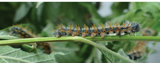
Rupsen grote vos (08-05-2017, Cuges-les-Pins, Frankrijk).

Zoals andere schoenlappers, overwintert de grote vos als volwassen vlinder in beschutte, koele en donkere plaatsen zoals in holle bomen, houtstapels of bunkers. Het is niet ongevoen om ze dan samen met andere schoenlappers aan te treffen. Na de winter, vooral in april en mei, zoekt het wijfje voor de eiafzetting vaak vrijstaande, zonbeschenen bomen uit waar ze haar gele eitjes rond de hoge twijgen in ringvorm legt. Uiteindelijk verkleuren de eitjes naar donkerrood.