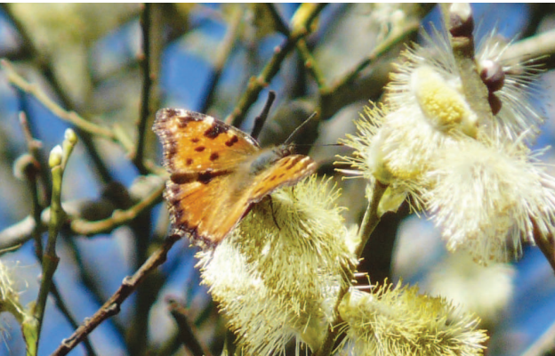
Grote vos (20-03-2014, Oignies-en-Thiérache, België).

De grote vos ( Nymphalis polychloros ) is een forse vlinder die nogal wat uiterlijke gelijkenis vertoont met de kleine vos. De grotere afmeting en de minder felle oranje grondkleur kunnen al een eerste aanwijzing geven maar voor betrouwbare determinaties zijn de volgende kenmerken veel belangrijker. Op de voorvleugelpunt (apex) komt geen helderwitte vlek voor zoals bij zijn kleinere naamgenoot. Midden op de bovenzijde van de voorvleugel zijn er vier forse, zwarte stippen en bij de kleine vos zijn dat er maar drie. Ook de donkere achterrand van de voorvleugels helpt want deze vertoont geen blauwe maanvlekken wat wel het geval is bij de kleine vos. De onderzijde is donker en biedt een prima camouflage om als vlinder tijdens de winter te overleven. De twee geslachten verschillen amper van uiterlijk en zijn moeilijk te onderscheiden.