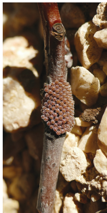
Detail eijtes grote vos (11-06-2017, Cuges-les-Pins).

Langs bosranden, op ooghoogte, verdedigen de mannetjes hun territorium. Ze geven de voorkeur aan korte vegetaties en opvallende punten in de omgeving. Zowel de mannetjes als de wijfjes zonnen graag op boomstammen aan bosranden met een goede expositie, zelfs laat op de dag. Ook de rupsen zitten graag in groep op uitstekende takken te zonnen waardoor ze opvallen en regelmatig het bezoek krijgen van sluipwespen. De rupsen zijn dikwijls geparasiteerd.