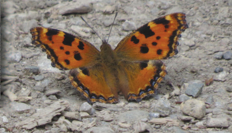
Grote vos (17-06-2017, Olloy-sur-Viroin, België).