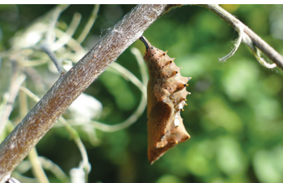
Pop van de grote vos (21-05-2017, Cuges-les-Pins, Frankrijk).