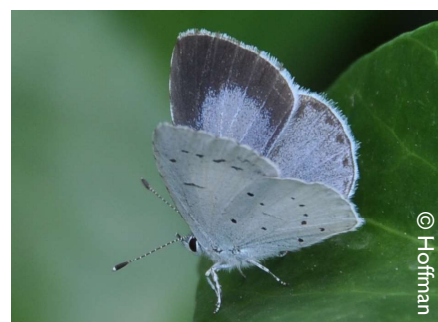
♀ Bovenzijde boomblauwtje in Waasmunster