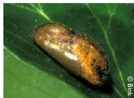
Pop van een boomblauwtje