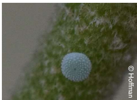
Eitje boomblauwtje op bolklimop in Waasmunster