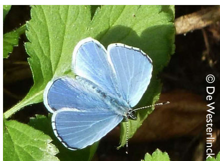
♂ Bovenzijde boomblauwtje in Elversele

Het boomblauwtje kan op veel plaatsen en in diverse biotopen in de regio worden waargenomen. Op tuilmuren, begroeid met oude klimop, kan de soort talrijk zijn. Het boomblauwtje kan je ook waarnemen in stadsparken, open bosgebieden en langs hagen waar de snelle vlinders vlot de hoogte ingaan. In het voorjaar is bloeiende laurierkers (paplaurier) 'the place to be' om op zoek te gaan naar dit Blauwtje. Ook op bloeiende heidepercelen kan je de soort regelmatig observeren. Het boomblauwtje doet het zeer goed in de regio en is niet bedreigd. Er is geen nood aan specifieke maatregelen bij het beheer maar grotere structurelementen aanbrengen kan zeker een pluspunt zijn voor de soort. Bosranden met mooie mantel- en zoomvegetatie zijn topgebieden voor het boomblauwtje. Klimop tot bloei laten komen in de tuin biedt extra kansen. Wat brengt de komende lente? Uitkijken en noteren! De nieuwsbrief van de VVE WG Dagvlinders ontvangen? Mail naar couckuyt.jurgen@telenet.be .