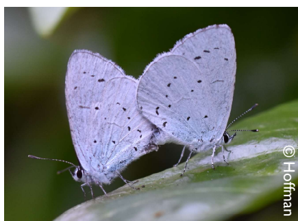
Copula boomblauwtjes in Waasmunster