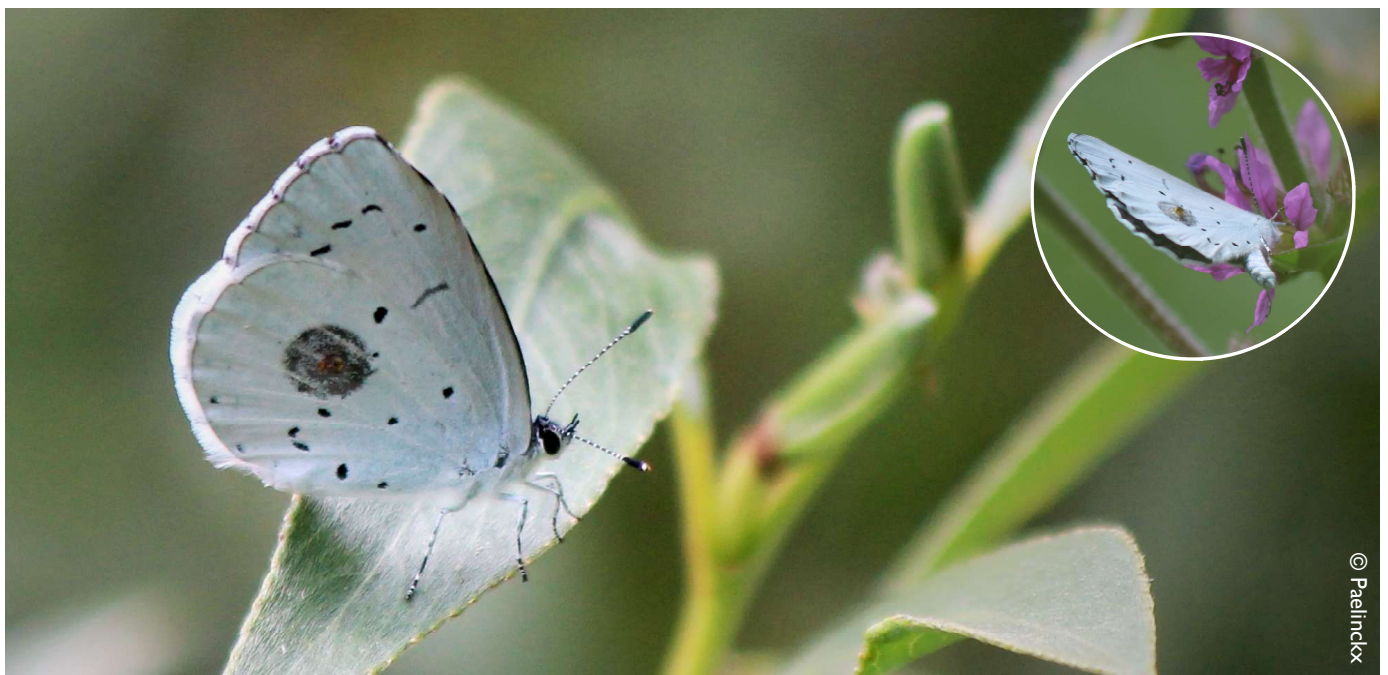
Boomblauwtje in Elversele met een ongewone vlek op de onderzijde van de achtervleugel, het gevolg van het bezoek van een knijtje.

Vroeger werden nogal wat andere namen gebruikt zoals het vuilboomblauwtje of het klimopblauwtje. Deze namen verwijzen rechtstreeks naar de verscheidenheid aan waardplanten. Midden maart komt de vlinder al met mondjesmaat uit de pop én vanaf april is het boomblauwtje talrijk aanwezig. De laatste vlinders van het jaar worden waargenomen met de start van de herfst. In 2020 kende het boomblauwtje een uitstekende start en was talrijk te zien. Tijdens de warme, droge zomer bleven de vlinders nog steeds goed aanwezig. Het werd dan ook het topjaar qua aantal waargenomen boomblauwtjes sinds de start van het project. Benieuwd of deze trend ook in het tuinmeetnet te zien zal zijn! Vermoedelijk zullen de boomblauwtjes dit jaar opnieuw goed uit de startblokken komen.