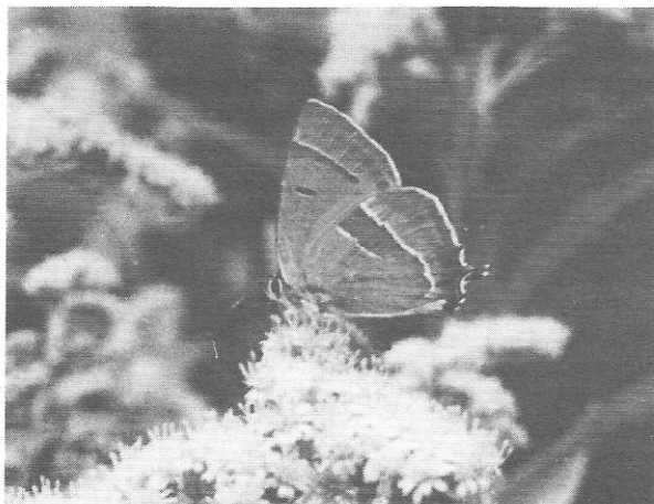
Fig. 2 : De Berkepage ( Thecla betulae L.)