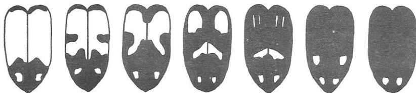
Figuur 2 : Drasterius bimaculatus Rossi, variaties in het vlekkenpatroon van de dekschilden (naar G.H. LOHSE 1979).

In verband met de levenswijze vermeldt LOHSE (l.c.) dat de larven zich ontwikkelen in zandstreken, vooral in de nabijheid van het water. Daar voeden ze zich met rottend plantenmateriaal. Het imago wordt aangetroffen van het voorjaar tot in de herfst onder stenen, rottende stoffen, plantenrozetten of gewoon vrij rondlopend in de zonneschijn.