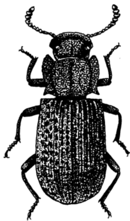
Figuur 1: Bolitophagus reticulatus , België, Brabant, Dilbeek, 03.VIII.2004, leg. W. Troukens.

Op 3 augustus 2004 vond ik in mijn kleine Heath-val te Dilbeek (Brabant) een mannetje van Bolitophagus reticulatus (Linnaeus, 1767). Ik had dit kevertje hier nog nooit eerder gezien.