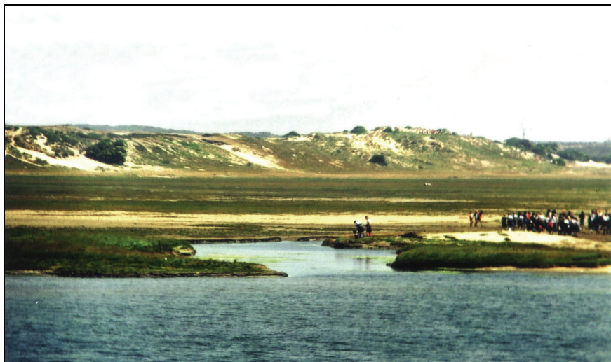
Figuur 1. Natuurreservaat Het Zwin, Knokke-Heist (België, West-Vlaanderen) op 14 juni 1976.