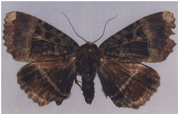
Fig. 1. Mormo maura (Linnaeus, 1758), Anderlecht, 30.ix.2010 (leg. en foto W. Troukens).

Op 16 augustus 2009 ving Bernard Misonne voor het eerst in zijn studiegebied te Tervuren (Vlaams-Brabant) een zwart weeskind, Mormo maura (Linnaeus, 1758). Op 2 september 2010 zat er opnieuw een exemplaar in zijn lichtval. Toen ikzelf te Anderlecht (Hoofdstedelijk Gebied Brussel) op 30 september 2010 eveneens voor het eerst een zwart weeskind ontdekte, kon het niet anders of er moest met die nachtvlinder wat meer aan de hand zijn.