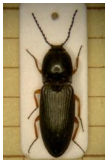
Fig. 1. Cardiophorus vestigialis Erichson, 1840; Wellin (België, prov. Luxemburg), 09.ii.2014, leg. H.Raemdonck.

Op 09.ii.2014 ontdekte ik te Wellin (prov. Luxemburg) een exemplaar van Cardiophorus vestigialis Erichson, 1840. De kever zat achter schors van een vermolmde den ( Pinus ) (fig.1). Dit kniptorretje is 7,5 mm lang. Kop, spriet en het bolle halsschild zijn zwart. Dekschilden eveneens zwart maar ook fijn behaard. Poten roodbruin met donkere tarsen. In het werk van Jeuniaux (1996: 55) wordt deze kever vermeld als Cardiophorus erichsoni du Buysson, 1901 maar deze naam slaat eerder op een verouderd synoniem (Lohse 1979: 18). C. vestigialis behoort met de 10 andere Belgische Cardiophorus -soorten tot de onderfamilie der Cardiophorinae die gekenmerkt worden door hun hartvormig schildje (Jeuniaux 1996: 55).