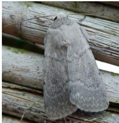
Caradrina gilva (Donzel, 1837), Hasselt (LI), 05.vi.2011, leg. en © C. Vanderydt.

Callopietria juvenina : 1 ex op 16.vii.2014 te Chiny, leg. K. Lock. Nadien ook op andere plaatsen in de Gaume. Nieuw voor LX.