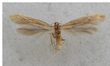
Fig. 1. Coleophora clypeiferella (Hofmann, 1871). Merksem (AN), 07.viii.2008, leg. & © G. De Prins.

Coleophora badiipennella : 1 koker op Corylus avellana op 03.v.2014 te Lavaux-Sainte-Anne, det. W. Ellis; 1 koker op Corylus op 09.viii.2014 te Bomal, beide leg. Werkgroep Bladmineerders. Nieuw voor LX en NA.