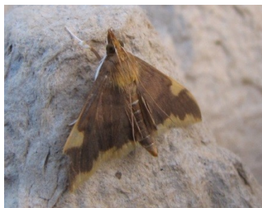
Fig. 3. Sinibotys butleri (South, 1901): Kessel-Lo, Vlaams-Brabant, 09.vii.2015, leg. & © K. Hansen.

Dyalima perspectalis : 1 egaal donkerbruin ex. op 30.viii.2014 te Koksijde, leg. R. Recour. Nieuw voor WV.