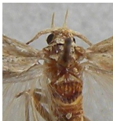
Fig. 2. Coleophora clypeiferella (Hofmann, 1871). Merkwaardige chitine-structuur op de eerste abdominale tergiet.

Coleophora clypeiferella : 1 ex. op 07.viii.2008 te Merksem, leg. G. De Prins. Voor zover geweten is dit de tweede melding van deze soort in België. Ze werd voor het eerst gemeld uit het Zoniënwoud, 1♂ zonder datum, leg. E. Janmouille. De rups leeft op Chenopodium (o.a. Ch. album ) maar zonder koker, wat heel uitzonderlijk is in