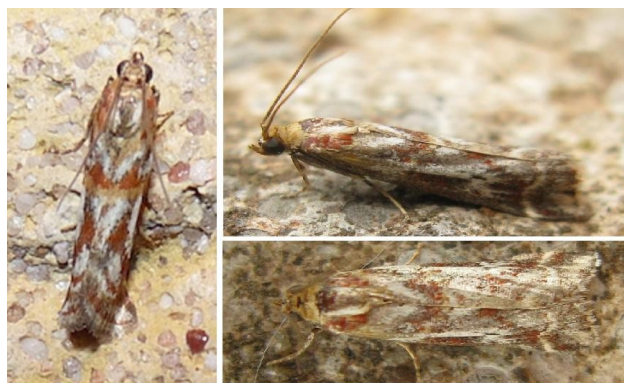
Fig. 7. Acrobasis porphyrella (Duponchel, 1836): a. Merelbeke, OV, 14.vii.2010, leg. & © K. Verplaetse; b–c. Nukerke, OV, 02.vii.2015, leg. & © S. Feys.

Acrobasis porphyrella (Duponchel, 1836) (fig. 7): Na de eerste waarneming van deze soort in het Kwenenbos te Merelbeke (OV) op 14.vii.2010, leg. K. Verplaetse, werd nu ook een tweede exemplaar gezien op 02.vii.2015 te Nukerke (OV), leg. S. Feys. Dit zijn tot nu toe de enige gegevens uit België van deze soort die een West-Mediterrane verspreiding kent. De rups leeft op Erica sp. Nieuw voor België en OV.