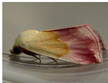
Fig. 4. Eublemma purpurina (Denis & Schiffermüller, 1775): Edegem (AN), 09.vii.2014, leg. L. Janssen.

Eublemma purpurina (Denis & Schiffermüller, 1775): 1 ex. op 09.vii.2014 te Edegem, leg. L. Janssen. Dit is de eerste waarneming van deze mediterrane soort voor de Belgische fauna. Een tweede ex. werd op 03.viii.2015 waargenomen te Veerle, leg. V. Van Dyck. De soort werd in Noord-Afrika en in de meeste Europese landen waargenomen behalve o.a. de Baltische Staten, Denemarken, Ierland, Luxemburg, Nederland, Noorwegen en Zweden. De rups leeft op Cirsium arvense . Nieuw voor België en voor AN.