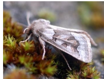
Fig. 8. Episema glaucina , Rocher Serin et Fond St.-Martin, bij Rochefort (NA), 07.x.2015, © P. Lighezzolo.

Episema glaucina – Zorro-uil: 1♀ op 07.x.2015 op de Belvédère van Han-sur-Lesse, bij Rochefort (NA), leg. P. Lighezzolo. Dezelfde waarnemer heeft op waarnemingen.be ook oude gegevens ingevoerd van dezelfde soort op dezelfde site, waaruit blijkt dat E. glaucina hier minstens in het begin van het millennium gewoon was (25 ex. op 27.ix.2003). Van deze soort, die altijd bijzonder lokaal was en strikt beperkt tot de Naamse kalkstreek, zijn slechts zeer weinig waarnemingen bekend.