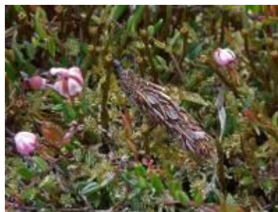
Fig. 10. Rups van Acanthopsyche atra in koker die gedeeltelijk met Andromeda -blaadjes is bedekt, Bihain (LX), 01.vii.2010, © H. Henderickx.

Acanthopsyche atra – Zwarte heidezakdrager: enkele rupsen in kokers die gedeeltelijk met Andromeda -blaadjes bedekt waren op 01.vii.2010 te Bihain (LX) en 1 imago op 27.iv.2012 te Bihain (LX), leg. H. Henderickx. Nieuw voor LX.