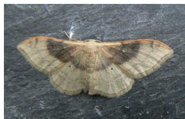
Fig. 5. Idaea degeneraria , Schipgatduinen te Oost-Duinkerke (OV), 21.v.2016, © D. De Groote.

Idaea degeneraria – Bandstipspanner: 1 ex. op 21.v.2016 in de Schipgatduinen te Oostduinkerke (WV), leg. D. D’Hert, R. Recour, D. De Groote, J. Dewolf, E. Thoen & R. Nossent. Tweede melding uit België, de eerste was op 05.viii.2007, Gaume, leg. J. Vanwynsberghe. Hoogstwaarschijnlijk een zwerver. De soort lijkt in West-Europa in opmars te zijn, en werd vrij recent ook al vastgesteld in het aangrenzende Franse departement Nord (Forêt de Saint-Amand-Wallers, 2007; lepinet.fr). In Frankrijk gewoon langs de kusten van Normandië en Bretagne, in het U.K. in Portland, Dorset en als migrant. Eerste maal in Vlaanderen! Nieuw voor WV.