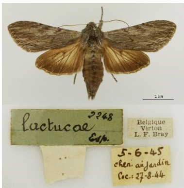
Fig. 7. Cucullia lactucae , Virton (LX), rups op 27.viii.1944, vlinder op 05.vi.1945, leg. L. F. Bray, coll. KBIN, © W. De Prins.

Chloanta hyperici – Sint-janskruiduil: 11 ex. op 10.vii.2016 op de terril van Waterschei (LI), leg. J. Van den Berghe et al. Van deze cultuurvolger werden de voorbije jaren doorgaans slechts geïsoleerde exemplaren gevonden. De soort werd in 2015 gevonden op de terril van Waterschei (LI) (leg. T. Sierens), waar de soort bij een telling in 2016 in onverwacht grote aantallen bleek te vliegen.