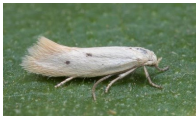
Fig. 1. Elachista distigmatella Frey, 1859. De Panne-Oosthoek (WV), 13.vi.2015, © D. D’Hert.

Elachista distigmatella Frey, 1859 – Schapengrasmineermot: 1 ex. op 13.vi.2015 te De Panne-Oosthoek (WV), leg. D. D’Hert & R. Recour, det. C. Steeman, gen. det. T. Muus. Dit is de eerste waarneming van deze soort voor de Belgische fauna. De rups mineert in Festuca ovina . De soort heeft een erg beperkte verspreiding in Europa: Finland, Litouwen, Polen en Zwitserland (Sruoga & Ivinskis 2005: 199).