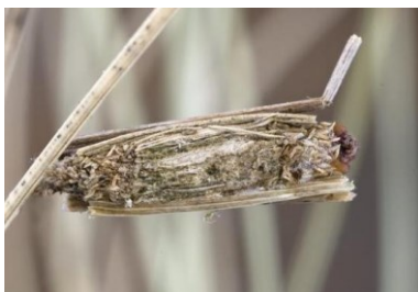
Fig. 14. Whittleia retiella , larve in koker, Het Zwin te Knokke (WV) 05.v.2009 © H. Henderickx.

Whittleia retiella – Kustzakdrager: Van deze zeer lokale en erg zeldzame soort werden op 05.v.2009 in het Zwinreservaat te Knokke (WV) zowel larven als adulten waargenomen, leg. H. Henderickx.