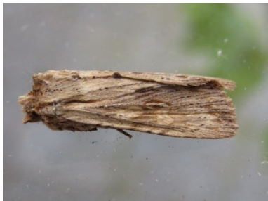
Fig. 9. Lithophane socia , Lebbeke (OV), 19.iii.2016, © R. Meert.

toegevoegd te worden aan de lijst van kustsoorten van België (Sierens 2015).