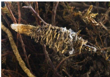
Fig. 12. Koker van Phalacropterix graslinella , Turnhouts Vennengebied (AN), 19.iii.2010, © H. Henderickx.

Phalacropterix graslinella – Veenheidezakdrager: een koker op 19.iii.2010 in het Turnhouts Vennengebied (AN), leg. H. Henderickx. Eén mannelijke koker werd ca. 20 jaar geleden aangetroffen in het Meergoor te Mol, maar ondanks intensief zoeken werd de soort er na 2000 nooit meer gevonden.