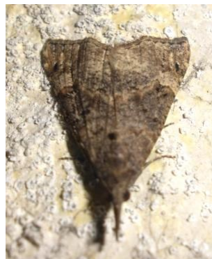
Fig. 2. Hypena obsitalis , Boekenbergpark, Deurne (AN), 10.i.2016, © L. Claes.

Hypena obsitalis – Dubbelstipsnuituil: 1 ex. op 10.i.2016 in het Boekenbergpark te Deurne (AN), leg. L. Claes. Nieuw voor AN. Het betreft hier de tweede waarneming in België van deze zeer zeldzame soort! De eerste melding was uit Wenduine (WV), 05.x.2010, leg. D. Sierens (Sierens 2011). De soort is duidelijk aan een areaaluitbreiding in noordelijke richting bezig en is inmiddels ook in Nederland gevonden. Recent is zelfs vastgesteld dat ze daar al in 2006 is gefotografeerd in bunkers in Noord-Holland ( www.vlindernet.nl ).