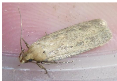
Fig. 3. Platyedra subcinerea , Zemst (BR), 20.v.2016, © E. Lauwers.

Platyedra subcinerea – Kaasjeskruidmot: 1 ex. op 31.v.2014 te Merendree-Durmen (OV), leg. J. Mees; 1 ex. op 20.v.2016, te Zemst (BR), leg. E. Lauwers; 1 ex. op 08.vi.2016 in het reservaat “Ijzermondig” te Nieuwpoort (WV), leg. R. Recour. Nieuw voor BR, OV en WV.