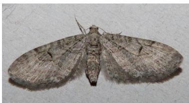
Fig. 4. Eupithecia distinctaria , Viroinval (NA), 28.v.2012, © J. Van Uytvanck.

Eupithecia distinctaria Herrich-Schäffer, 1848 – Tijmduergspanner: 1♀ op 28.v.2012 te Viroinval (NA), leg. J. Van Uytvanck en W. Decock, det. W. Veraghtert. Dit is voor zover bekend de eerste en enige waarneming van deze soort voor de Belgische fauna. Ze is wel bekend uit kalkgraslanden in het nabij gelegen departement Ardennes in Frankrijk. Bij ons in het verleden mogelijk over het hoofd gezien en verward met nauw verwante soorten van hetzelfde geslacht. Nieuw voor België en voor NA.