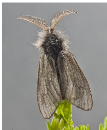
Fig. 11. Acanthopsyche atra ♂, Bihain (LX), 27.iv.2012, © H. Henderickx.