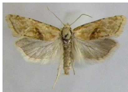
Fig. 18. Cochylimorpha straminea , Domein Vrieselhof, Oelegem (AN), 29.vii.2016

Cochylimorpha straminea – Moerasbladroller: 1 ex. op 29.vii.2016 in het Vrieselhof te Oelegem (AN), leg. & gen. det. G. De Prins. Nieuw voor AN.