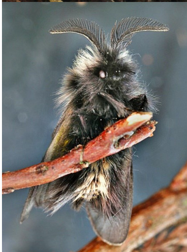
Fig. 13. Phalacropterix graslinella ♂, Turnhouts Vennengebied (AN), 06.v.2010, © H. Henderickx.

Whittleia retiella – Kustzakdrager: Van deze zeer lokale en erg zeldzame soort werden op 05.v.2009 in het Zwinreservaat te Knokke (WV) zowel larven als adulten waargenomen, leg. H. Henderickx.