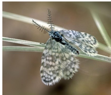
Fig. 16. Whittleia retiella , een pas uitgekomen ♂, Het Zwin te Knokke (WV) 05.v.2009 © H. Henderickx.