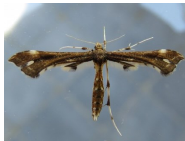
Fig. 17. Buszkoiana capnodactylus , Vlassenbroekse Polder en Schorren te Baasrode bij Dendermonde (OV), e.l. Petasites hybrida 27.iv.2016 © R. Meert.

Buszkoiana capnodactylus – Chocolaatje: 1 ex. e.l. Petasites hybridus op 27.iv.2016 in de Vlassenbroekse Polder en Schorren te Baasrode bij Dendermonde (OV), leg. R. Meert. Nieuw voor OV. Het is trouwens de eerste waarneming van deze lokale en zeldzame soort in Vlaanderen.