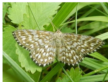
Fig. 6. Scopula tessellaria , Torgny (LX), 18.vi.2016, © J. Elst.

Agnoea latipennella – Oostelijke zaksikkelmot: 1 ex. op 21.v.2016 te Genk (LI), leg. Werkgroep Bladmineerders, gen. det. S. Wullaert. Nieuw voor LI. Het was meer dan 70 jaar geleden dat deze soort nog in België werd waargenomen.