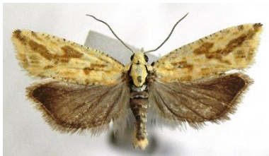
Fig. 19. Thiodia citrana , Groot Buitenschoor te Zandvliet (AN), 06.ix.2016, leg. en © G. De Prins.

Thiodia citrana – Citroenbladroller: 1 ex. op 06.ix.2016 in het Groot Buitenschoor te Zandvliet, leg. G. De Prins. Deze zeer zeldzame soort was reeds bekend uit AN maar werd er sinds 1951 niet meer waargenomen. De meeste exemplaren van deze soort in het KBIN werden in juli waargenomen, en dit is een erg late vondst.