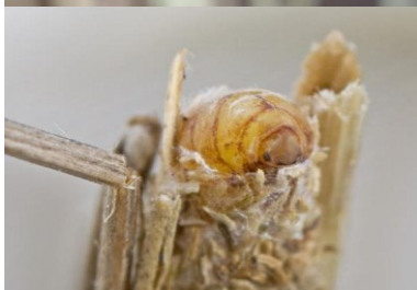
Fig. 15. Whittleia retiella , een pas uitgekomen ♀ blijft in de koker, Het Zwin te Knokke (WV) 05.v.2009