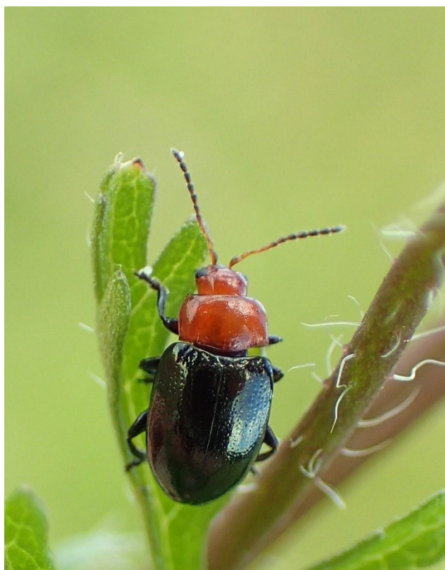
Fig. 1. Podagrica fuscipes . Boutonville (HA), 15.vi.2018.

Het artikel over de stokroosaardvlo, Podagrica fuscicornis (Linnaeus, 1767) (Troukens 2018: 70–72), motiveerde enkele keverkenners om op zoek te gaan naar de zwartpotige verwant, Podagrica fuscipes (Fabricius, 1775). Jean-Yves Baugnée observeerde op 15.vi.2018 een 10-tal exemplaren te Boutonville nabij Chimay (HA). De kevertjes zaten in een hooiweide op muskuskaasjeskruid ( Malva moschata ) (Fig. 1).